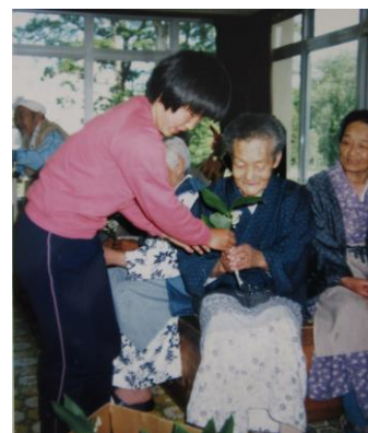
昭和60年ごろの すずらん贈りの様子

時代とともに、「すずらん贈り」の活動の仕方は変化してきていますが、日頃お世話になっている人たちへ感謝の気持ちを伝えることや、だれかのことを思う「やさしい心」は、今も子どもたちにしっかりと受け継がれています。もうすぐ半世紀を迎えるすずらん贈りの意義を、今後も子どもたちに伝えていきます。