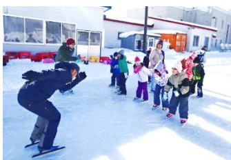
地域名人のスケート学習サポート