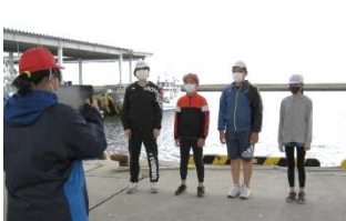
別海町の自慢を取材しPR動画で発信