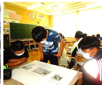
「まわし読み新聞」で感想交流、