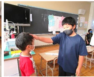
人間関係スキルアップ学習