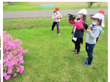
タブレットを文房具として活用