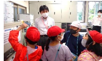
中西別で働く人から学ぶキャリア教育