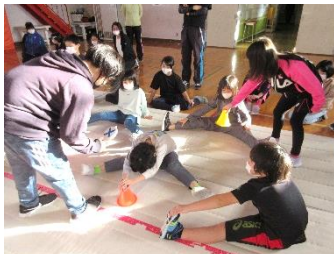
全校で体力作り「元気アップ」 (からだやわらか大会)