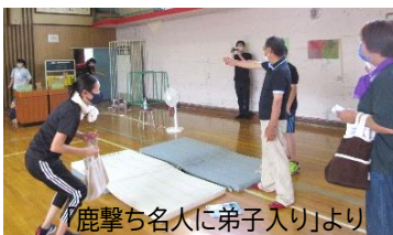
『鹿撃ち名人に弟子入り』より 地域の名人に弟子入りし技や文化を継承