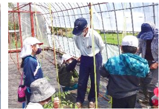
地域の名人から野菜作りを学ぶ