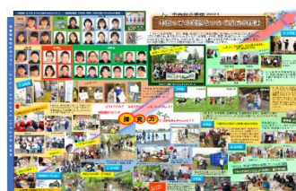
「成長を見る会」誌上開催