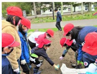
春の集会(いも植え)