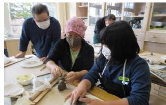
地域の方を講師に中学校で陶芸教室

中西別の地域や人との関わりを深め、長年続いている伝統を守るため、積極的に地域行事に参加しています。令和3年度は感染症への対応のため地域行事は中止になりましたが、ふるさと祭りや開拓当時から受け継がれてきた地域行事を継承されてきた人々の思いに触れる学習により理解を深めました。「子どもの成長を見る会」を誌上開催し、保護者や地域の方々に、園児、小中学生、高校生の成長した姿を見ていただきました。