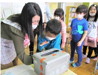
感染症予防スキル学習 (手洗い指導)

感染症に負けない健康力の強化を図り、体育の時間以外にも朝活動や放課後を活用し運動に取り組んでいます。体力向上の帯活動で実施し体力テストや記録会を行い、目標に向かって最後までやり抜こうとする根気、粘り強さも育てています。