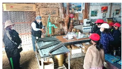
中西別の郷土資料館「イエローハウス」で中西別の歴史を学ぶ