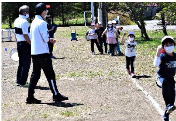
中学校体育専門教師による走り方教室