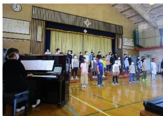
学習サポーターの全校合唱伴奏