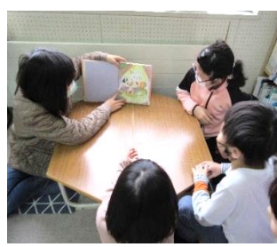
読書推進活動(5・6年生の読み聞かせ)