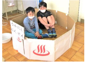
6年間の系統的な心と体と命の学習