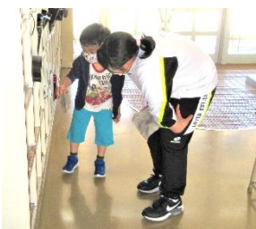
縦割り活動・掃除

集会の企画、準備、運営等の体験を通し、自主性・実践力を高めるとともに、上級生のリーダー性発揮の大切さを実感させ、思いやりの心を育む縦割り班活動に取り組んでいます。一年を通じた四季の集会や毎日の清掃活動、縦割り活動デーの班単位での遊び等仲良く活動することを通し、関わり合う力を高めています。