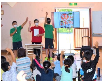
校内ビブリオバトル

言葉と出会い、楽しみ、語彙力を高め、見識を深めるために、読書とNIEを進めています。朝読書や全校読書推進を教育課程に位置付け、町移動図書館「白鳥号」や町ビブリオバトルを積極的に活用しています。「別海町新聞の日」を活用した授業や朝活動、「まわし読み新聞」の取組を通して感想交流を行っています。また、タブレットを活用し思考力や表現力、発信力を高め、町内の学校や博物館とつながる学習を進めています。