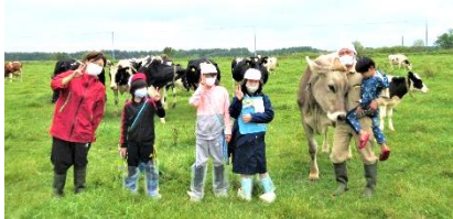
中西別の牧場を訪ね酪農業の魅力を探究

地域の教育資源を生かして複数の教科を横断的につなぐ教育課程を編成することにより、授業をつなぎ、子どもの探究力と生き生きと学ぶ力を高めています。また、地域人材を学習サポーターとして活用し、スケートの指導やピアノ伴奏の協力を得ながら、体育や音楽等の技能教科の楽しさと、表現力を高めています。