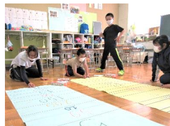
夏の集会(チャレンジランキング)