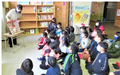
幼小合同読み聞かせ