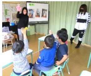
養護教諭の幼稚園出前保健授業