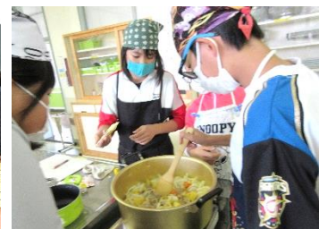
秋の集会(収穫した野菜を調理)