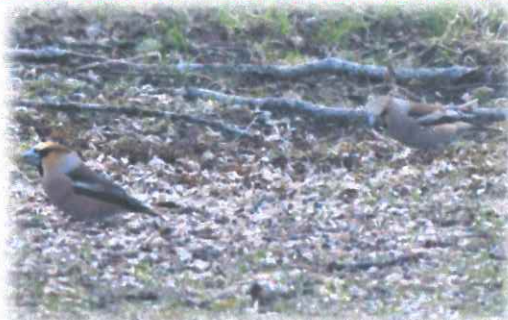
子どもシメがボーイフレンドを 連れてきた♪