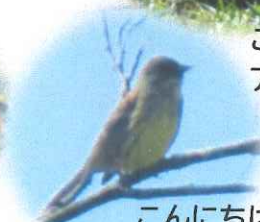
こんにちは！ キセキレイです♪