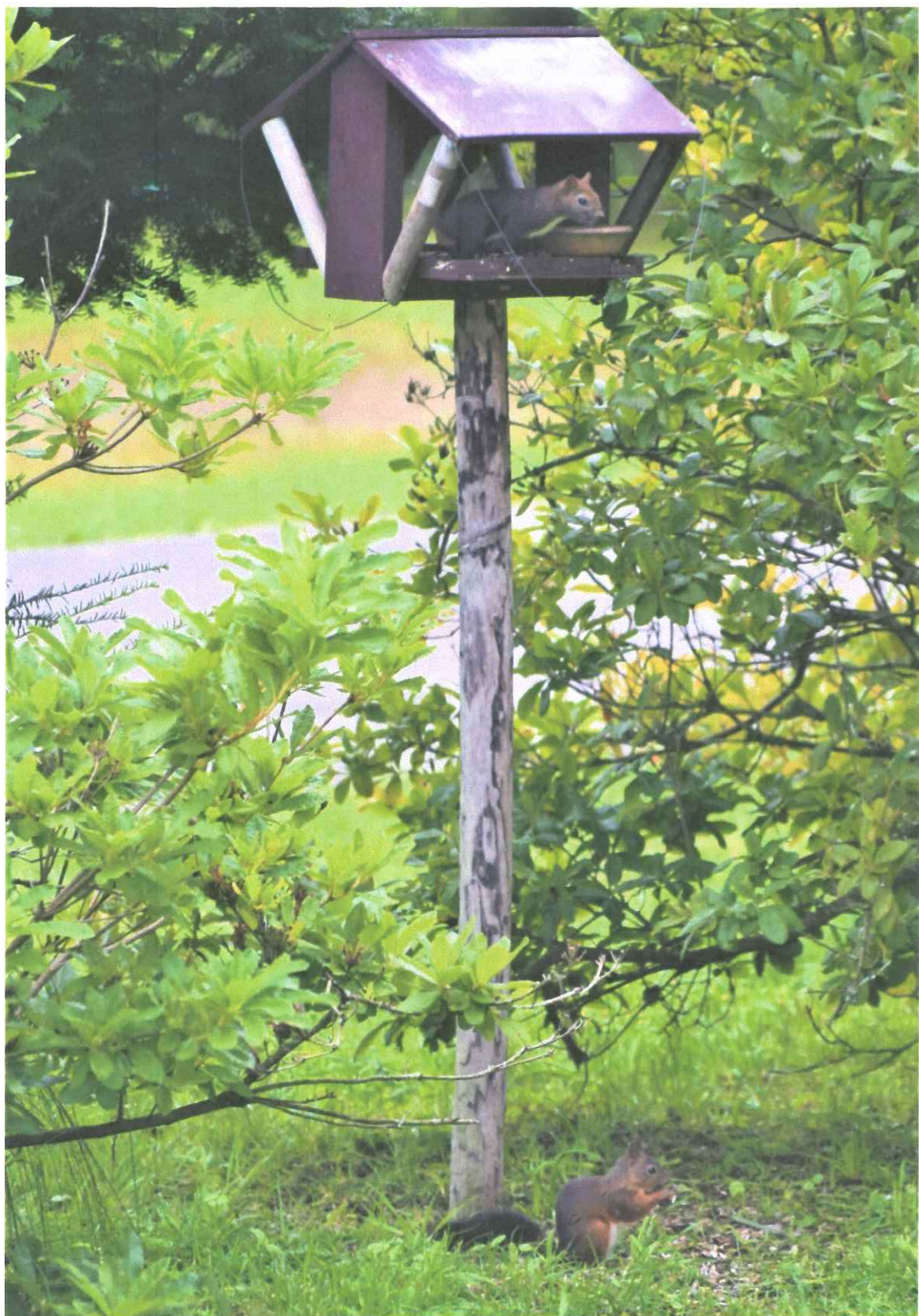
8月のある日、小さなエゾリスが2匹、やって来ました。