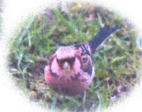
こんにちは！ ベニマシコです♪