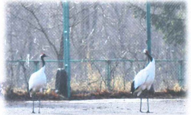
春の日ざし 気持ちがいいね…