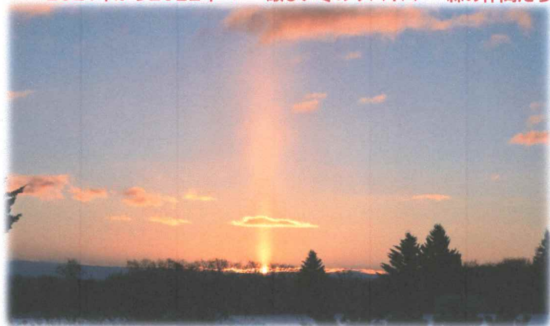
サンピラー(太陽柱)の夜明け