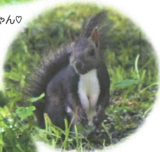
ママリスも元気そう♡