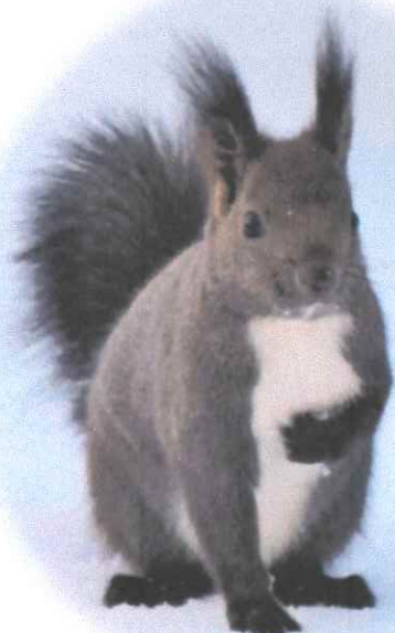
お母さんはリスコ