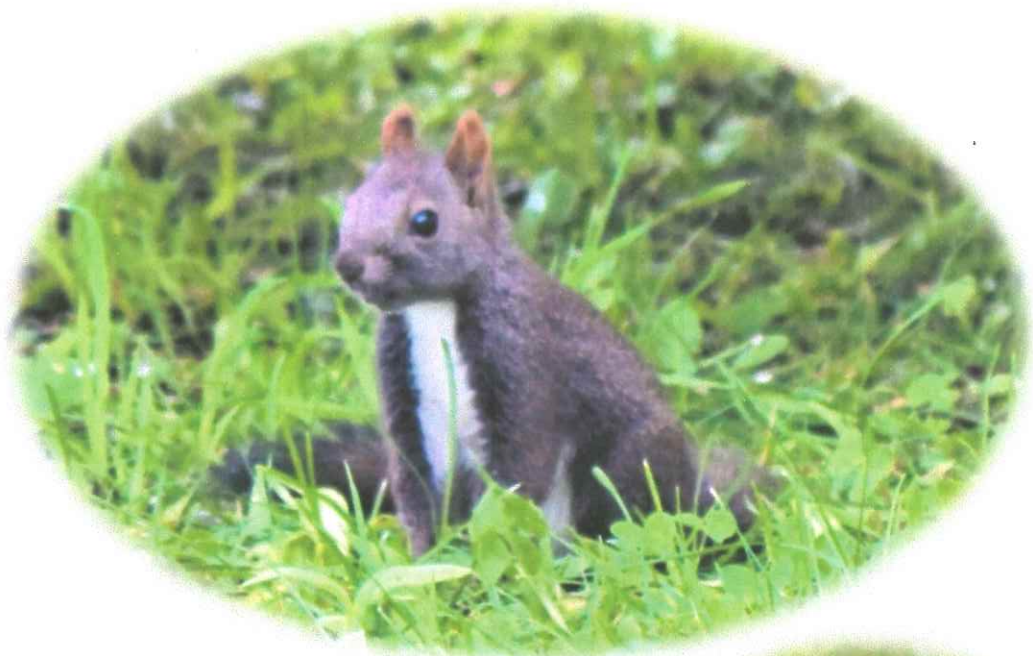
1匹はママリスそっくりのちびリスちゃん♡