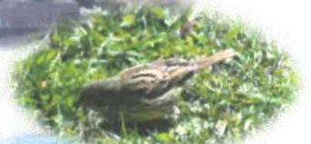
こんにちは！ アオジです♪