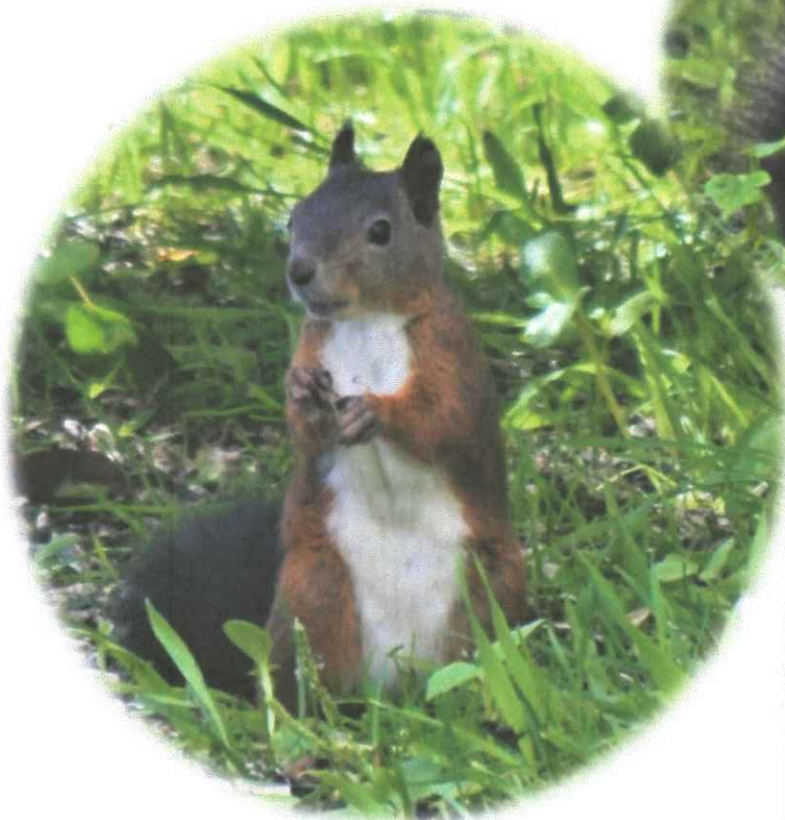
もう1匹は赤毛ちゃん♡