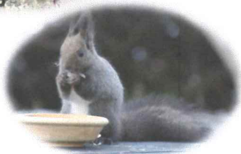
子リスは2匹、好奇心いっぱい!