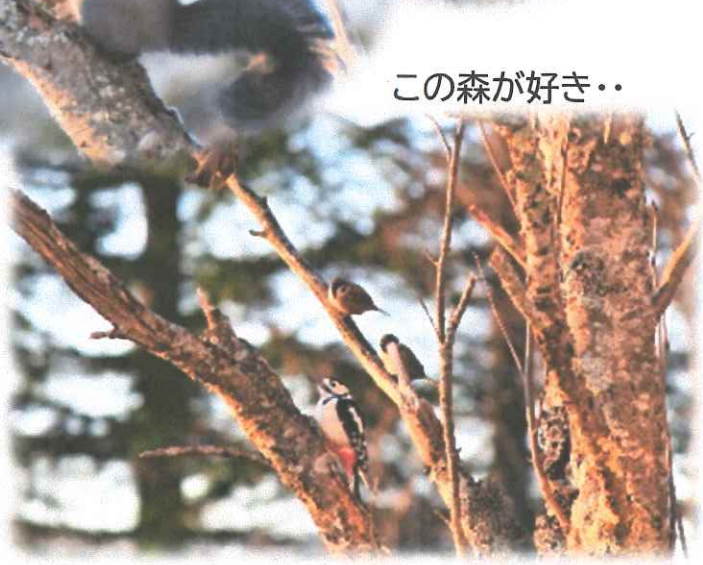
この森が好き・・・