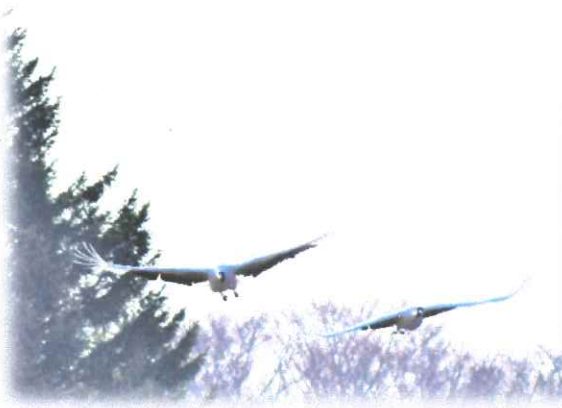
グラウンドにタンチョウヅルが まいおりて…マウンドチェック？