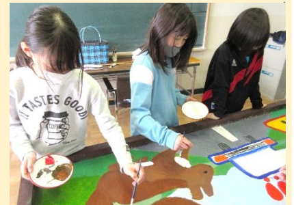
地域・保護者の方のご協力で進めた交通安全の看板作り。(3年生)

一つ目の挑戦は、学びをつなぐことです。中西っ子は、学習の過程で気が付いたことや考えたことを友達と伝え合い、生き生きとした豊かな学びを実現しました。言葉や図やタブレットを駆使して学んだことをつなぐ姿は実に頼もしく、私たち教職員に新たな可能性を教えてくださいました。