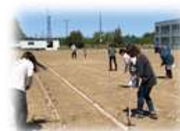
100mやトラックの草は綺麗になりました

6月3日（土）に行われる運動会は、本校が開校してから多くの人たちが積み重ねてきた営みや歴史に思いを馳せながら、西春別の地で運動会ができる喜びと感謝の気持ちを忘れず、応援を力に変え、励まし合い最後まで頑張ろうとする機会にしたいと思います。