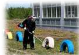
大変暑い中での作業、有難うございました

先日PTA環境整備作業がありました。作業は主にグラウンドやその周辺の草刈り・草むしりで、予定していた以上の多くの保護者の皆さんにご参加をいただきました。また、運動会当日は中学生もボランティアとして運動会運営に協力してくれます。中学生ボランティアの姿は、小学生が中学生になったときのお手本、憧れの姿を示してくれます。地域あつての学校だと改めて感謝いたします。