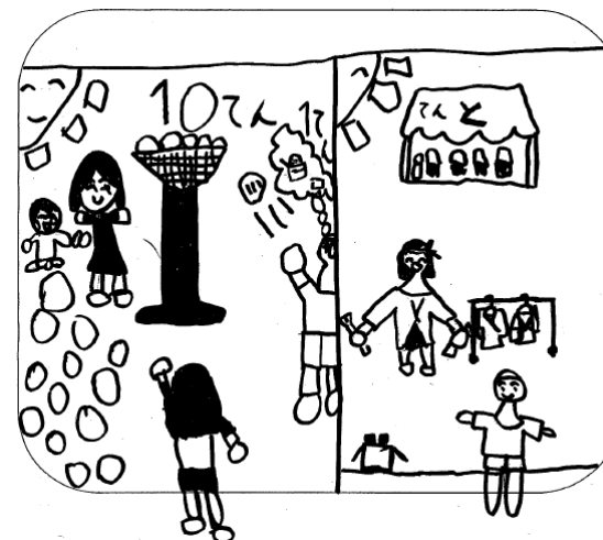
2年 T. Y