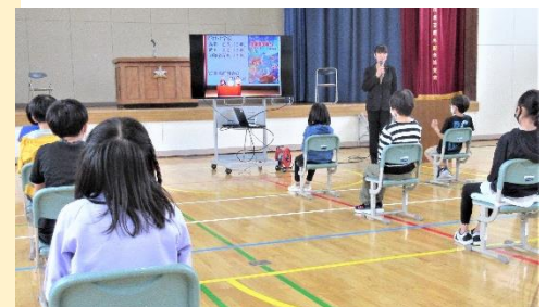
学校評価アンケートの結果から、1学期の成長の手応えと課題、2学期にみなくて目指す学校のお話を聞く子供たち