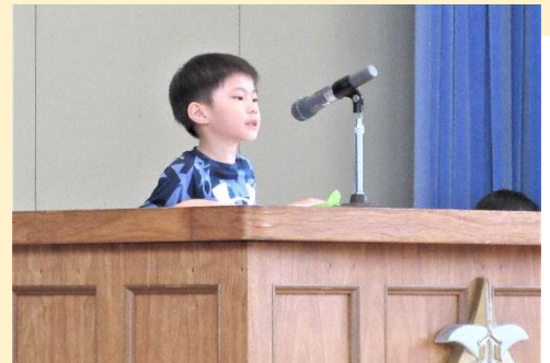
始業集会で、夏休みの思い出と2学期楽しみなこと、頑張りたいことを自分の言葉で力強く語る1年生代表児童

今、新しい時代の学校の在り方として、教育活動全体を通じた子供たちの Well-Being (ウェルビーイング) の向上を図ることが求められています。社会の変化や子供たちが抱える困難が多様化・複雑化する中、一人一人の Well-Being (ウェルビーイング・幸福で充実した人生をおくるために必要な潜在能力) が大切であることが社会全体で再認識されたからです。学校で幸せに生きる種や芽を育む要素は様々です。同学年や異学年の子供同士のつながり、地域とのつながり、協働性、利他性、多様性の理解、サポート、自己実現(達成感)、心身の健康、安全・安心な環境などなど。そして、それぞれの重要度には個人差があり多様性があると考えます。そこで、「にこにこ言葉」の文化がある野付小学校では、Well-Being (ウェルビーイング) を『にこにこ』と訳して、心、体、頭の『にこにこ』が いっぱいの 2 学期を目指すことにしました。わくわくすること、きらきらすること、楽しいこと、好きなこと、嬉しいこと、頑張りたいこと、できるようになりたいことなど、一人一人『にこにこ』を見つけてチャレンジできるように、全教職員でサポートしていきます。学芸会や宿泊研修、音楽祭などの行事や地域に飛び出して学ぶ体験も大切にしながら、88 日間の 2 学期の教育活動に取り組んでいきます。ご理解とご協力をお願いいたします。