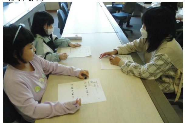
「どのように解いたか説明してみてね!」