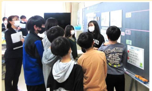
考え方をボードに表現し対話的に課題解決する5年生

子供が主役の学び合いには、地域の皆様に見守られて15歳まで育ち合う野付の子供達の強みを生かされ、一人一人の可能性を引き出して伸ばす手応えがありました。目指す「心が動く教育」は、学校を飛び出す校外学習でも教室での日々の授業や活動でもできることを再確認しました。子供達から学び、子供達と共に成長していく学校づくりを、これからも進めていきます。