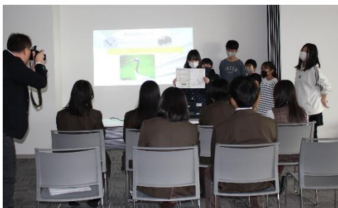
4年生は、高校生との「別海町防災サミット」で、野生動物との共生をテーマに、「野付学」で学んだこと、考えたことを言葉や資料で伝えました。

※自分から考え、言葉で表現しながら学ぼうとチャレンジしてきた実感が伝わってくる結果になりました。「学んだことを言葉で表現すること」は2学期の重点として全校児童が取り組んできたことです。この手応えを3学期、次の学年へとつなぎます。