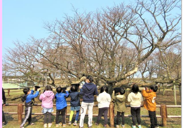
タブレットを活用し千島桜を観察する1年生

野付小学校の児童は多くありませんが、思いやりをもって協力しあい、困難にも負けずに一生けんめいがんばる千島桜のような力を一人一人がもっています。先生方といっしょにすごせることがとても楽しみです。今日からお世話になります。よろしくおねがいします。