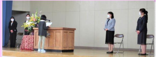
着任式 児童代表(6年生)歓迎の言葉より

予測が難しい状況の中で、野付が育ててきた子どもたちのたくましさ笑顔に励まされています。感染のリスクを低くしながら、一人一人の子どもの内にある花のつぼみが次々と開花し実を結べるように、今、学校ができることを考え、教職員一丸となって取り組んでいきます。どうぞ引き続きご理解とご協力をお願いします。