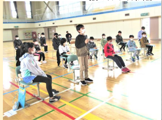
感想を発表する5年生