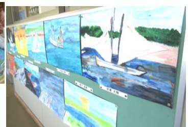
野付の風景を図画に表現(5年生)