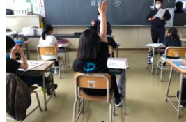
2年生国語授業より