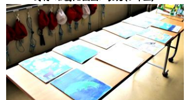
野付半島ツアーの体験から国語リーフレット作りにつなげて表現(4年生)