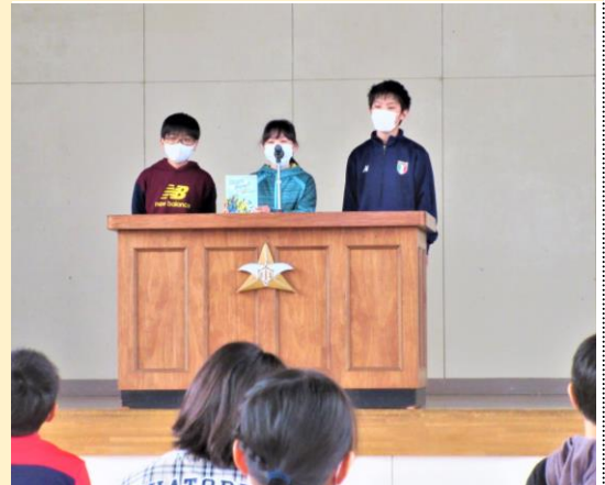
校内ビブリオバトルより(6年生)

夏休み、子どもたちは楽しみにしていることや、やりたいことがいっぱいあるようです。家族や地域の方と言葉を交わし共に過ごす時間も、子どもたちのかけがえのない成長の機会になります。健康で楽しく有意義な夏休みになるよう祈っています。