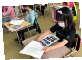
野付漁協の方を講師にアサリ・ホタテについて学ぶ3年生