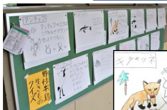
野付半島いきものクイズに表現(2年生の学習より)