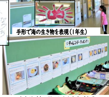
家庭科で身に付けた力を家庭で実践(6年生「チャレンジクッキング」)