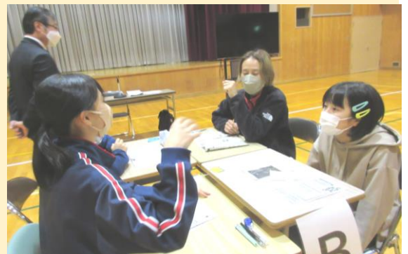
5年生と中学2年生とCSの「まわし読み新聞」より

明日から24日間の冬休みです。家族や地域の方と言葉を交わし共に過ごす時間も、子ども達のかけがえのない成長の機会になります。健康で楽しく有意義な冬休みになるよう祈っています。