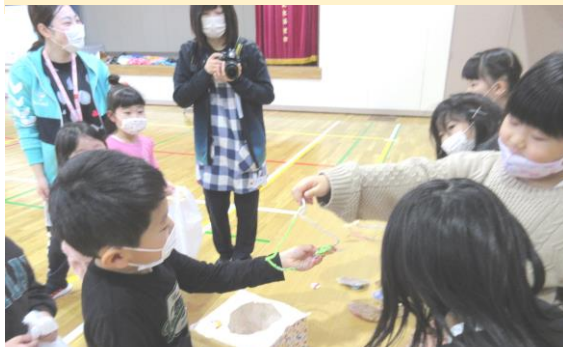
1年生と幼稚園さくら組さんの「たからものらんど」より