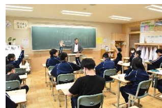
心の健康講座 (2年生)