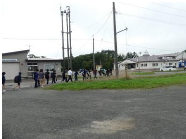
保小中合同防災訓練