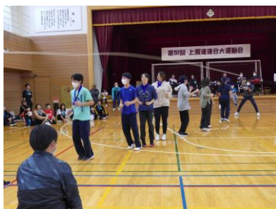
上風連連合大運動会

多くの方と関わる中で、学びを深めています。地域にある各団体の方々と一緒に活動しながら、別海町そして上風連のことを学び多くの経験・体験をしています。