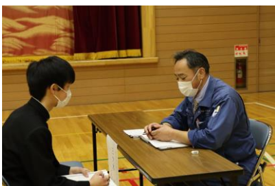
職業インタビュー

1年生は職業インタビュー、2年生は職業体験、3年生は上級学校訪問と発達段階を踏まえてキャリア学習が行われています。