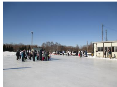
小中合同スケート大会