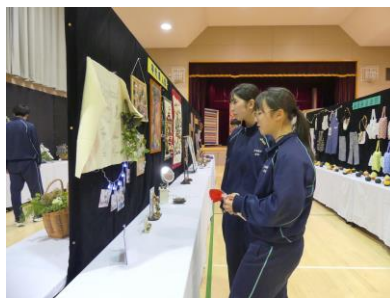
上風連地区文化祭